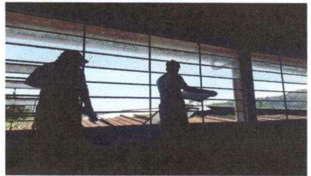
Foto 4: Comenzando los trabajos de estructura de metal de ventana