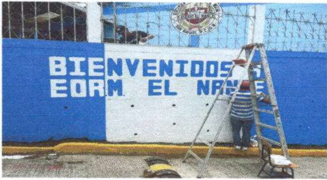
Foto1: Se ve que ya estan pintando