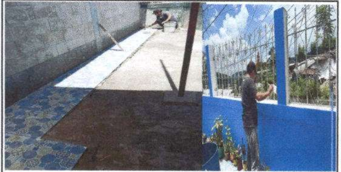
Foto 2: Se inician los trabajos de pintura y reparación de torta de concreto